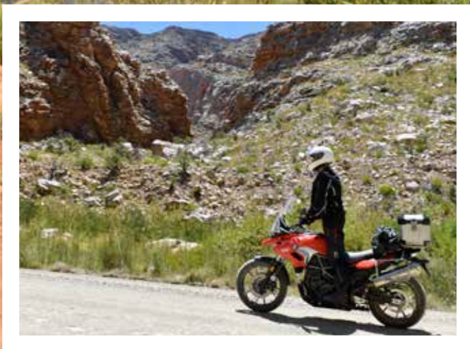
Sør Afrika har tusenvis av kilometer med fine grusveier.