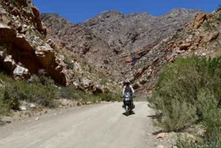
Kløften Seweweekspoort er trang og dramatisk. Vi kjenner på lukten flere steder, at vi er i nærheten av ville dyr.