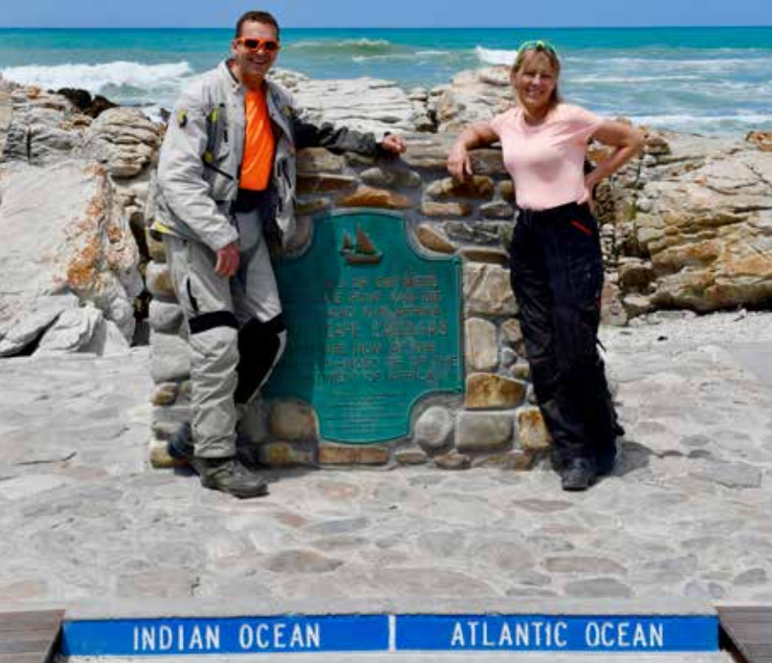
Cape Agulas er Afrikas sydligste punkt, og skiller Atlanteren fra det Indiske hav.