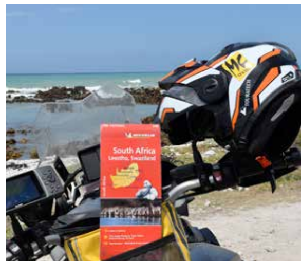
Med kart, GPS og kjentkvinne, nyter vi indrefiletten av Sør Afrika.