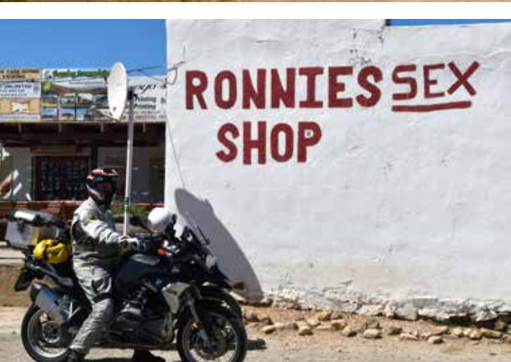
En av Afrikas merkeligste puber, ligger langs Route 62; Ronnies Sex Shop.