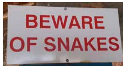
De finnes mye artige kryp i Sør Afrika.

Vi er ikke de eneste skandinavene til frokost på Auberge Alouette Guesthouse. Hele seks svensker spiser frokost sammen med oss. Alle såkalte «vinturister». Dette betyr at de reiser fra vingård til vingård og prøvesmaker. Med seg har de hver sin «vinbibel» fra området som guider dem på veien. Kanskje dette blir det neste når motorsyklene parkeres en gang for godt.