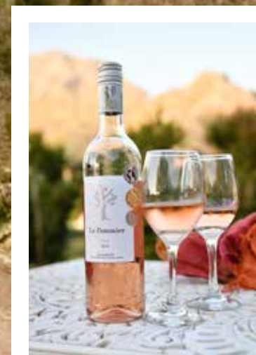
Vi overnatter på en av Sør Afrikas mange vingårder som til byr overnatting og prøvesmaking.