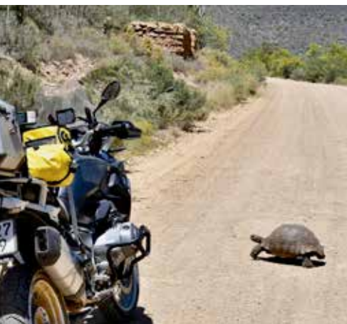
Treffer du en av de mange landskilpaddene, som krysser veien, kan du få deg et luftig svev. Pass deg for denne krabaten.