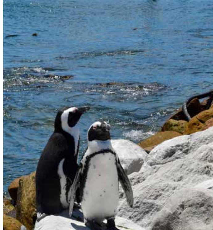
I Bettys Bay, kan du få nærkontakt med en av Afrikas to pingvin-kolonier.

kokt når vi stopper for lunsj. Det blir å jobbe for å gjenopprette væskebalanse, temperatur og humør.