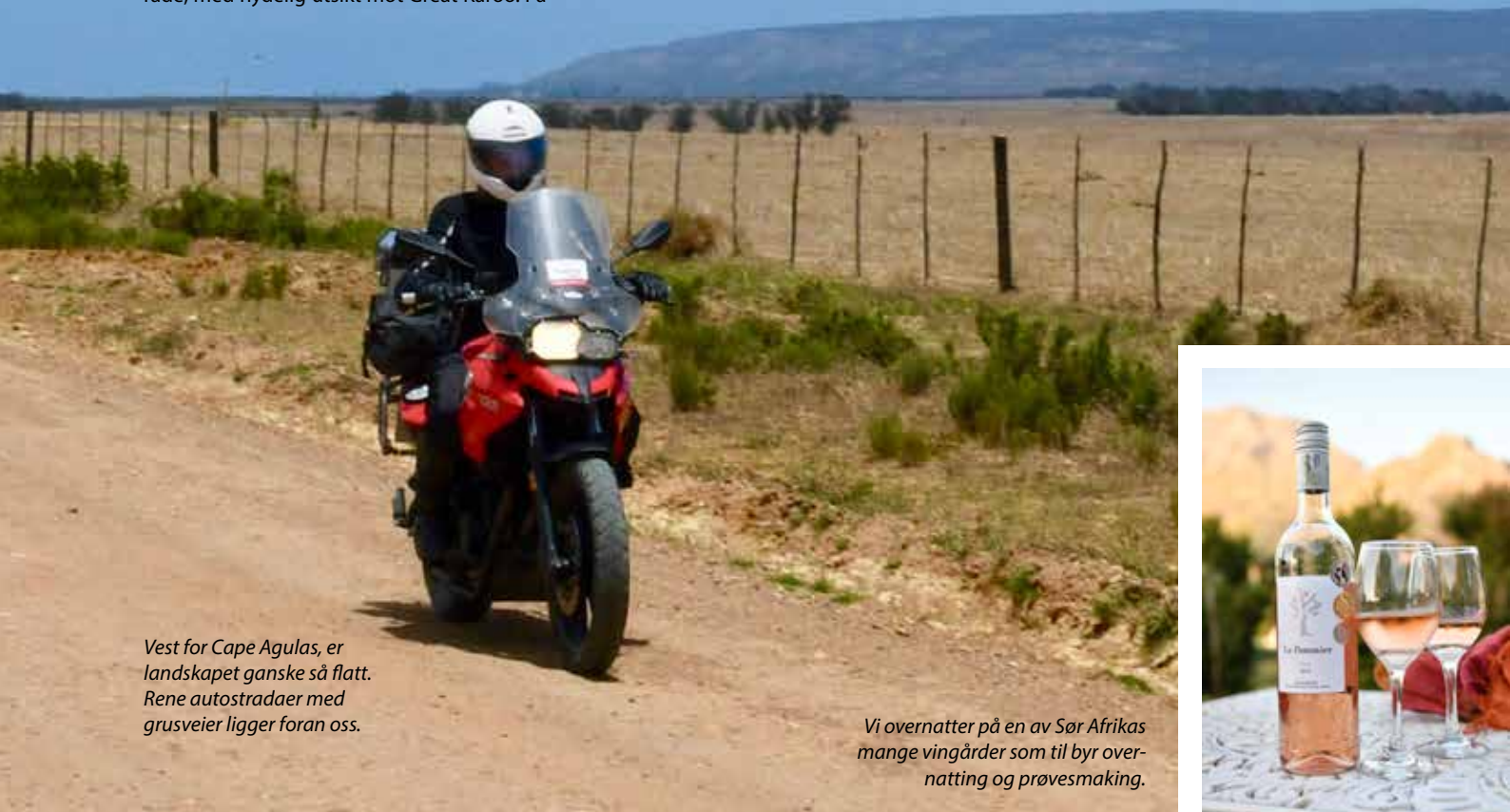
Vest for Cape Agulas, er landskapet ganske så flatt. Rene autostradaer med grusveier ligger foran oss.

Vi er allerede halvveis på turen og må sette kursen vestover igjen. Denne gangen på små grusveier på nordsiden av Route 62. Veien snor seg mellom flere nasjonalparker, før vi igjen kommer til Calitzdorp. Vi passerer fine gårder og små bortgjemte steder. Varmen er i det meste laget, og A-Rypdal er nærmest