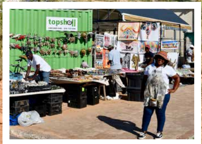
På markedet i Franschhoek, selges diverse hjemmesnekret «kunst». Vi gjør en stor handel.