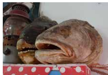
Det finnes mye liv i havet her nede.