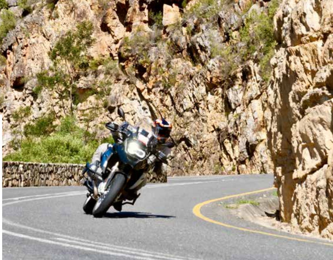
Vi trosser varmen og kjører gjennom Zuurberg Natur Reservat. Steilbratt på den ene siden, og med dramatiske stup på den andre. Fargene er fantastiske.