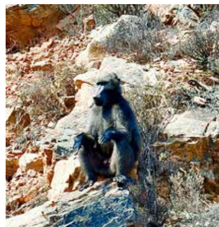
Bavianer krysser veibanen flere steder. Du bør ikke stanse for nærme disse.