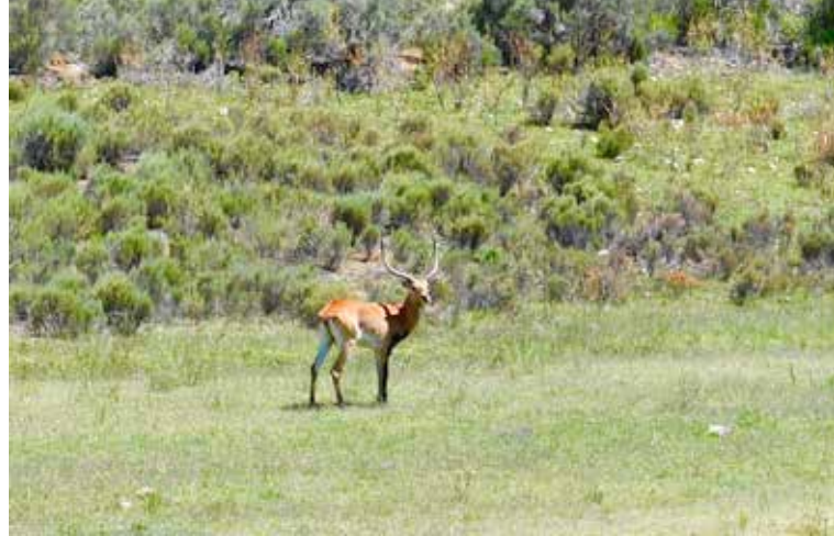
Vi kjører langs en rekke naturreservater. Nydelige springbukker gresser på ei slette rett ved veien vi kjører.